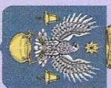
Герб г. Котельникдово

Котельникдово рос и развивался. Указом Президиума Верховного Совета РСФСР от 13 июля 1955 г. рабочий посёлок Котельниковский был преобразован в город районного подчинения с присвоением наименования – город Котельникдово.