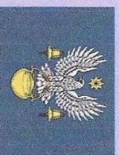
Флаг г. Котельникдово

25 апреля 2023 г. Городу Котельникдово присвоено почетное звание Волгоградской области «Рубеж Сталинградской доблести».